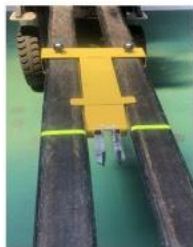
①引抜き器具を取り付け (別売)