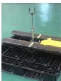
⑦『人要らず』は パレットの上に