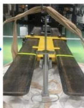
③引抜き器具の爪を 『人要らず』に入れる