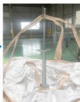
②コンテナバックに 『人要らず』を取り付け