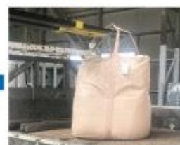
⑤荷物の移動させる